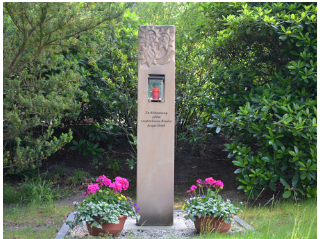
Sandstein-Stele mit „ewigem Licht“