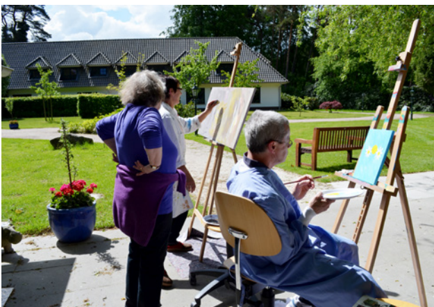
Eltern beim Malen in unserem Garten

Die Angebote orientieren sich an den Interessen, Wünschen und individuellen Fähigkeiten der Kinder und Jugendlichen. In der Erfahrung und Auseinandersetzung mit vielfältigen Spielsachen und Materialien können die Kinder unterschiedlichen Alters zudem ihre Wahrnehmungen, Gefühle, Ideen und Gedanken gegenüber unseren Erzieher*innen ausdrücken. Auch gemeinsame Aktionen und Ausflüge in und um Hamburg stehen auf dem Tagesprogramm.