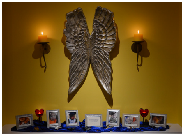
Im Raum der Stille erinnern Fotos an die im laufenden Jahr verstorbenen Kinder