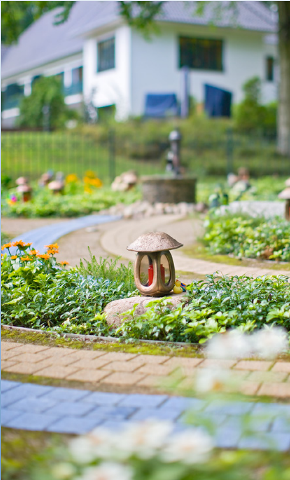
Eine Lampe im Garten der Erinnerung

Die Sternenbrücke ist ein Ort, wo dem Sterben Würde und der Trauer Raum und Zeit gegeben werden. Der gemeinsame Weg des Sterbenden und seiner Angehörigen wird fürsorglich begleitet. Die Mitarbeiter*innen gehen mit hoher Professionalität mit den Lebensthemen Sterben, Tod und Trauer um, damit betroffene Familien diesen schweren Weg individuell gestalten können. Trauer ist keine Krankheit. Sie kann aber krank machen, wenn sie verdrängt wird und unverarbeitet bleibt. Wenn das geschieht, „ersticken“ Trauernde an ihren Tränen.