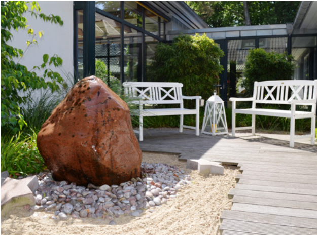
Unser Innenhof im Jugendhospiz

Innenhof Rückzugsmöglichkeiten für die jungen Gäste. Zwei der Räume sind durch interne Treppen mit dem oberen Stockwerk verbunden. Hier sind Appartements entstanden, in die sich die Angehörigen und Freunde zurückziehen können und dabei dennoch in der Nähe der erkrankten jungen Erwachsenen bleiben. Damit auch sie jederzeit zu ihren Angehörigen gelangen können, gibt es im Flur vor den Zimmern einen extra hierfür eingebauten Glasfahrstuhl.