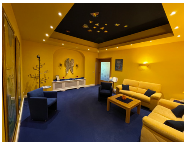
Raum der Stille