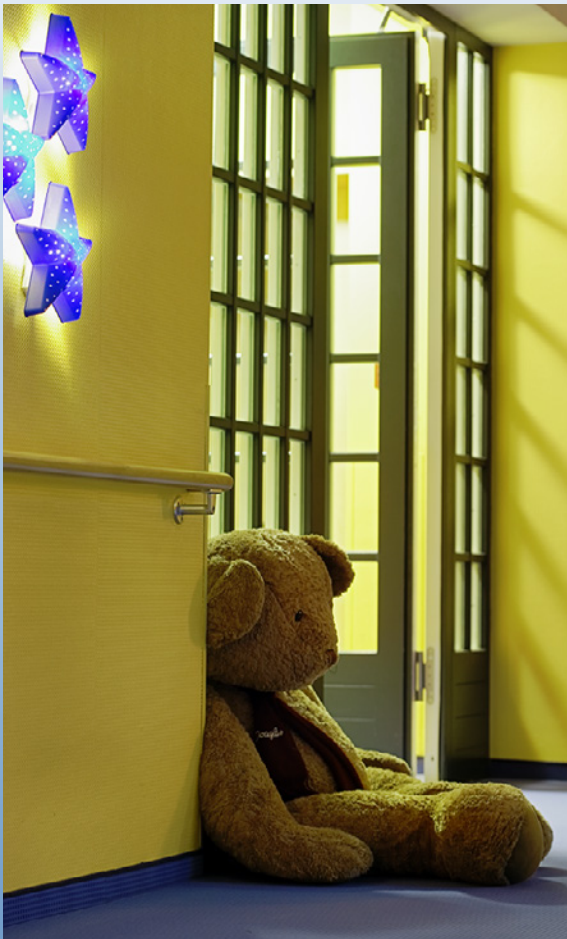
Liebevoller Details auf dem Flur

Das Kinder-Hospiz Sternenbrücke liegt im Westen Hamburgs im Stadtteil Rissen. Das 1939 erbaute, schöne Haus ist von einem großen mit alten Bäumen umstandenen, begrünten Grundstück umgeben. Es ist ruhig gelegen, verfügt aber dennoch über eine gute Anbindung in die Hamburger Innenstadt.