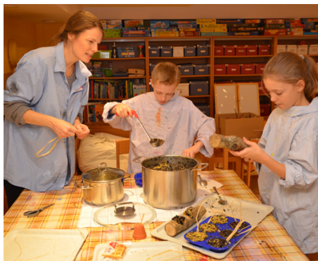
Unsere leitende Erzieherin mit Geschwisterkindern