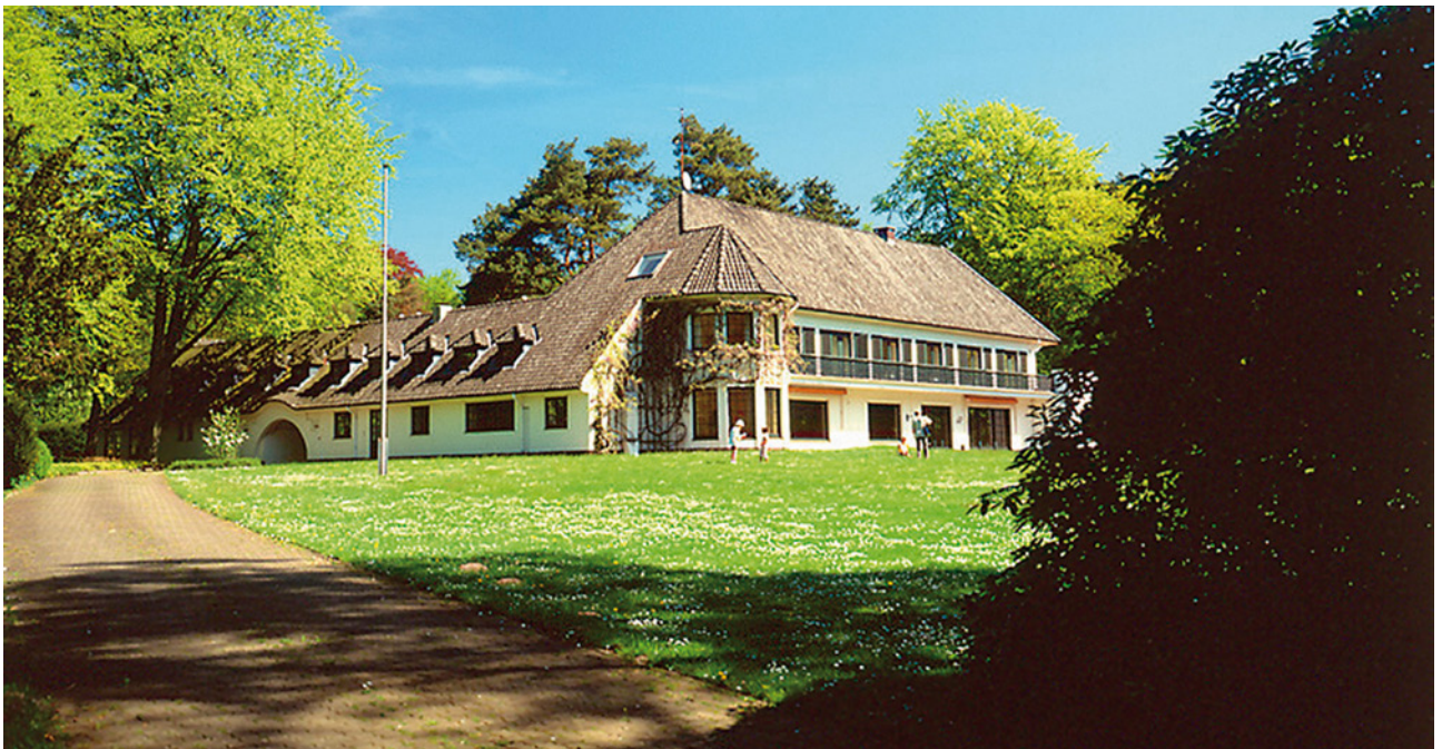
Die Sternenbrücke in Hamburg Rissen

Um eine einfühlsame und umfassende Begleitung betroffener Familien finanziell sicherstellen zu können, ist das Kinder-Hospiz Sternenbrücke auf Spenden und Unterstützung angewiesen.