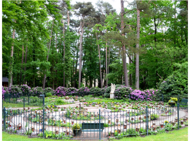
Garten der Erinnerung

Vor dem Garten der Erinnerung steht eine Sandstein-Stele mit einem „ewigen Licht“, das zum Andenken an alle verstorbenen jungen Menschen dieser Welt immer brennt. Briefe und Gedichte, Bilder und Zeichnungen von den Angehörigen im Gedenken an den verstorbenen jungen Menschen haben einen festen Platz im Kinder-Hospiz Sternenbrücke. Ein aus Sandstein gestalteter „Briefkasten der Erinnerung“ bewahrt sie. Am einmal jährlich begangenen „Tag der Erinnerung“ wird dieser besondere Briefkasten geleert. Die Briefe werden in einem liebevollen Ritual verbrannt und die Familien können so ihre Gedanken, Wünsche und Hoffnungen als Rauch zu den Sternenkindern in den Himmel steigen lassen. Erlebtes und Erinnerungen bekommen Raum, Gespräche können geführt oder sich einfach nur still im Arm gehalten werden. Zudem gibt es eine Andacht im Garten der Erinnerung, bei der die Namen aller in der Sternenbrücke verstorbenen jungen Menschen genannt werden. Viele betroffene Familien lassen anschließend für ihr Sternenkind ein Schiffchen mit Zeilen und einer brennenden Kerze auf dem kleinen Teich im Garten des Kinder-Hospiz Sternenbrücke schwimmen.