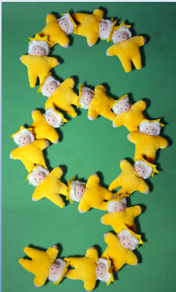
Unterstützung und Beratung in allen sozialrechtlichen Belangen

Familien, deren Kinder lebensbegrenzt erkrankt sind leben in einer besonderen Belastungssituation. Sie stehen vor großen Herausforderungen bei der Pflege und Erziehung ihres erkrankten Kindes und müssen dabei auch immer das Wohl der Geschwisterkinder im Auge behalten. Oft sind die Familien bei der Sicherstellung der Versorgung ihres erkrankten Kindes auf Unterstützungsangebote angewiesen, die ihnen zum Teil einen erheblichen bürokratischen Aufwand abverlangen. Durch die besondere, zeitintensive Pflege ihres Kindes, sind sie teilweise gar nicht mehr in der Lage, diesen Aufwand zu bewältigen.