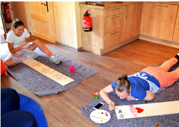
Verwaiste Geschwister beim Gestalten von Seelenbrettern in unserer Blockhütte