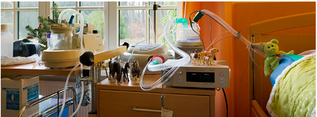
Medizinische Geräte in einem Kinderzimmer

Junge Erwachsene können in der letzten Lebensphase selbst entscheiden, ob lebenserhaltende Maßnahmen fortgeführt werden sollen. Wenn der Sterbende jedoch nicht mehr in der Lage ist, seinen eigenen Willen zu äußern, werden Patientenverfügungen bedeutsam. Gerade aber bei jungen Menschen, deren Krankheit bereits im Jugendalter begonnen hat, liegt mitunter keine Patientenverfügung vor, wenn sie zum Zeitpunkt der Volljährigkeit nicht mehr in der Lage waren, ihren unmissverständlichen Willen zu äußern. In diesen Fällen ist oft ein gesetzlicher Betreuer bestellt. Häufig haben die Eltern diese Aufgabe übernommen. Gemeinsam mit ihnen wird am Lebensende eine für den Sterbenden gute und sinnstiftende Entscheidung gesucht. Soweit es dem Betroffenen krankheitsbedingt noch möglich ist, wird er in diesen Findungsprozess umfassend mit einbezogen.