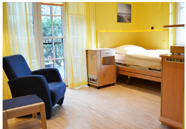
Zimmer für junge Erwachsene

Zwei der Kinderzimmer liegen ein wenig abseits in einem gesonderten Bereich. Im Gegensatz zu den anderen Zimmern sind diese beiden Räume speziell für junge Menschen vorbehalten, die aufgrund ihrer Erkrankung mit besonderen Hygienemaßnahmen versorgt werden müssen oder viel Ruhe benötigen. Ein Zimmer wird zudem für Kinder in der letzten Lebensphase freigehalten. Dieses ist durch eine interne Treppe mit dem darüber liegenden Elternzimmer verbunden. So ist ein enges Beieinander in dieser besonderen Lebenssituation jederzeit möglich, ohne die Treppen auf den Fluren nutzen zu müssen.