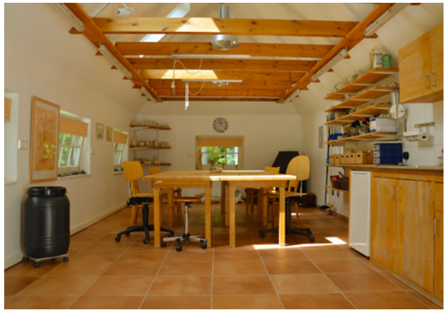
Die Steinwerkstatt der Sternenbrücke

Die besonderen Angebote der Gemeinsamkeit von betroffenen Familien und Mitarbeiter*innen können helfen, nach dem Verlust Brücken zueinander und in ihr zukünftiges Leben zu bauen. Eine individuelle und professionelle Begleitung dieser Familien ist die Basis dafür, dass sie irgendwann wieder einen Weg in ein Leben finden, das ihnen wertvoll und lebenswert erscheint und sie nicht an dem Verlust zerbrechen lässt.