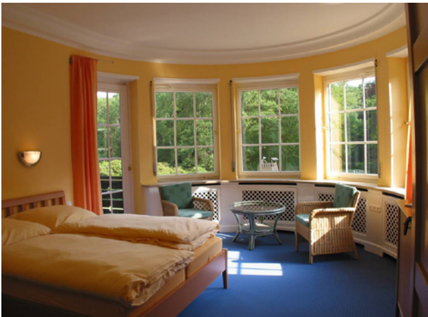
Zimmer für die Angehörigen

Im Obergeschoss der Sternenbrücke befinden sich die liebevoll gestalteten Zimmer und Appartements für die Angehörigen. Hier können sich die Eltern und Geschwister, Partner und Kinder sowie Freunde der erkrankten jungen Gäste in ihre Schlafzimmer zurückziehen und sind dabei dennoch in der Nähe der erkrankten jungen Menschen. Alle Räume sind mit Doppel- oder Einzelbetten, Kleiderschränken, Regalen und gemütlichen Sitzmöbeln ausgestattet. Jedes Zimmer verfügt über ein Bad mit Dusche, ein Telefon und einen Fernseher. In den separaten Zimmern für die Geschwisterkinder befinden sich CD-Player.