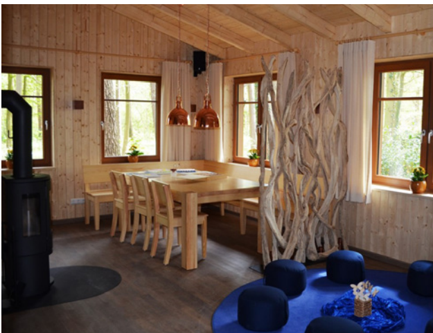
Die Blockhütte bietet viel Platz