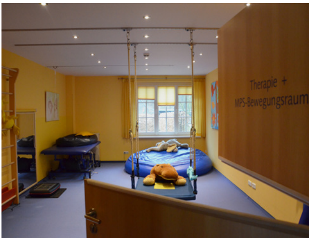
Therapie- und MPS-Bewegungsraum

Im Rahmen der Musiktherapie werden die erkrankten jungen Menschen mit einer Therapeutin musikalisch aktiv und können sich mithilfe von leicht zu spielenden Instrumenten ausdrücken. Eine Klangwelle im Musiktherapieraum, bei der durch das Anspielen von Tönen vibrierende Schwingungen entstehen, hilft dem erkrankten Kind, sich zu entspannen. Besonders wichtig ist dies für erkrankte Kinder, Jugendliche und junge Erwachsene, deren Sinneswahrnehmungen nur teilweise ausgeprägt sind, also die zum Beispiel erblendet oder erblendet sind. Darüber hinaus kann die Therapeutin auf verschiedenen Zupf-, Blas- und Streichinstrumenten musizieren und dem erkrankten jungen Menschen so tiefenentspannende Erholungsmomente ermöglichen. Das Einbeziehen von Familienangehörigen in die Therapie kann eine bereichernde Erfahrung darstellen, die alle Beteiligten Zusammengehörigkeit empfinden lässt.