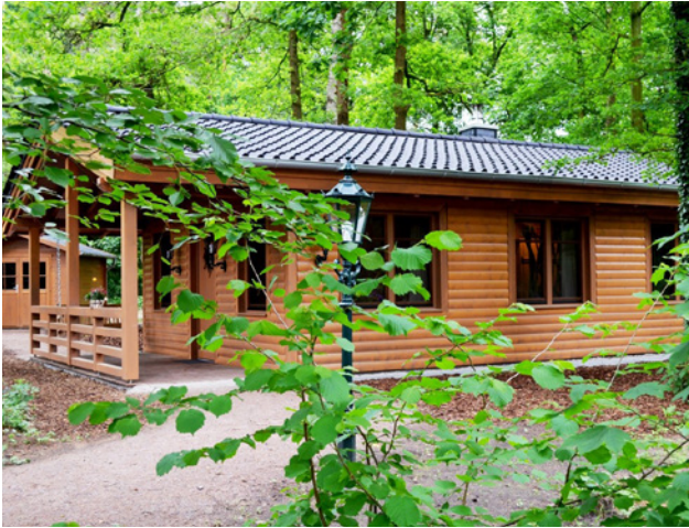
Die Blockhütte auf dem Gelände der Sternenbrücke