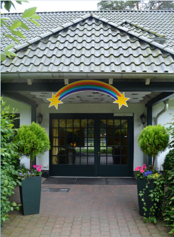
Eingang zum Kinder-Hospiz Sternenbrücke

Nach Schätzungen leben in Deutschland inzwischen bis zu 50.000 Kinder, Jugendliche und junge Erwachsene, die an Krankheiten leiden, die ihr Leben so sehr beeinträchtigen und verkürzen, dass sie noch im jungen Alter daran versterben.