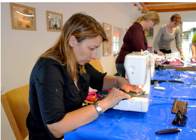
Mütter beim Nähen in unserer Steinwerkstatt