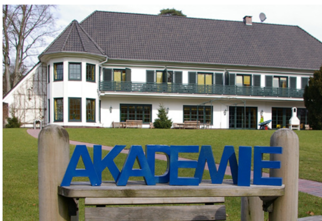
Fort- und Weiterbildungen unter dem Dach der Sternenbrücke

Eltern und Angehörige von schwerkranken Kindern und Jugendlichen sowie ehrenamtlich Tätige in der Betreuung und Begleitung von Familien mit einem lebensbegrenzt erkrankten Kind haben eine verantwortungsvolle Aufgabe und leisten wertvolle Arbeit. Mit einem entsprechenden Seminarangebot möchten wir ihnen die Möglichkeit der Hilfe und Unterstützung mit dem besonderen Blick auf die Pflege in der Häuslichkeit aufzeigen. So zeigt eines der Seminare Hilfestellungen und Unterstützungsmöglichkeiten zu Atemtherapeutischen Maßnahmen auf, während sich zwei weitere Seminare, die im Wechsel angeboten werden, Fragen rund um das gesetzliche Betreuungsrecht sowie der erbrechtlichen Vorsorge für behinderte junge Menschen widmen.