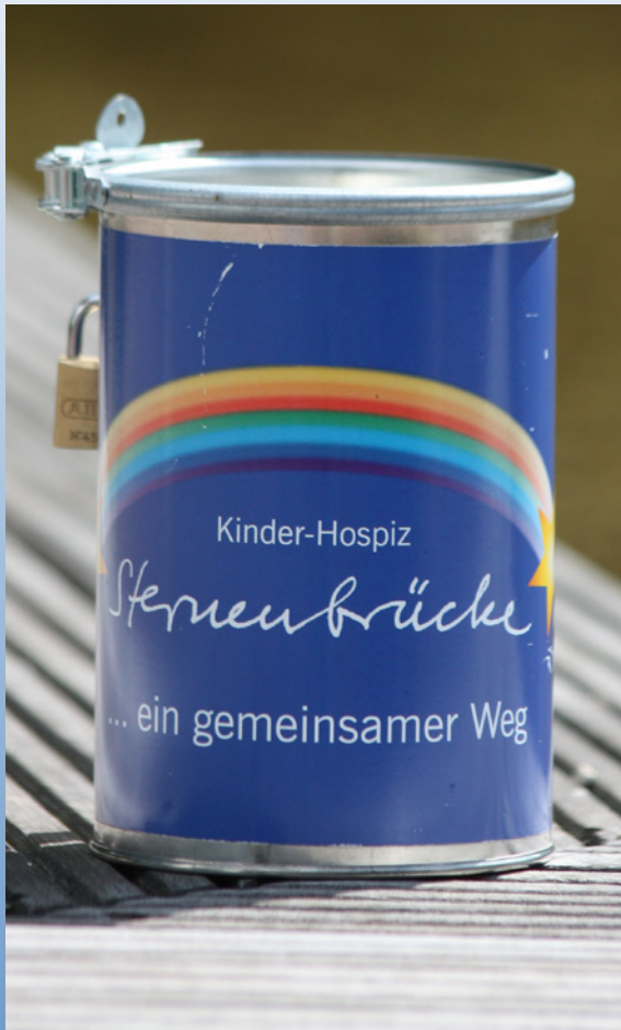
Eine Spendendose der Sternenbrücke

Die gesetzlichen Rahmenbedingungen zur Finanzierung von stationären Kinderhospizen sind durch das Hospiz- und Palliativgesetz und die Rahmenvereinbarung für stationäre Kinderhospize ab Mai 2017 erstmalig auf Bundesebene konkretisiert worden.