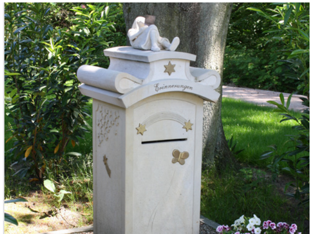
Briefkasten der Erinnerung