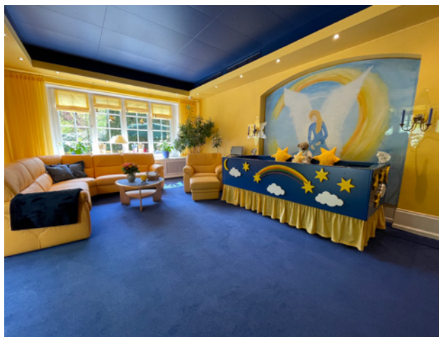
Abschiedsbett mit Kühlfunktion im Abschiedsraum

Vor dem Abschiedsraum liegt der Raum der Stille. Ist ein Sternenkid verstorben, brennt eine Kerze am Eingang des Abschiedsbereiches. Das Lämpchen ist von Schmetterlingen umgeben, die die Unsterblichkeit der Seele symbolisieren. Im Raum der Stille können Kerzen für liebe Menschen entzündet werden und Andachten stattfinden. Er ist ein Ort des Rückzugs, um in der Stille in sich gehen, trauern oder beten zu können. Auch hier, an der Decke des Raumes, ist das Sinnbild des Schmetterlings präsent. Unter einem silbernen Flügelpaar erinnern Fotos an die im laufenden Jahr verstorbenen jungen Menschen. Der Raum wurde zudem so konzipiert, dass er – im Falle des gleichzeitigen Versterbens zweier unserer erkrankten Gäste – die Möglichkeit bietet, ihn als einen weiteren Abschiedsraum zu nutzen.