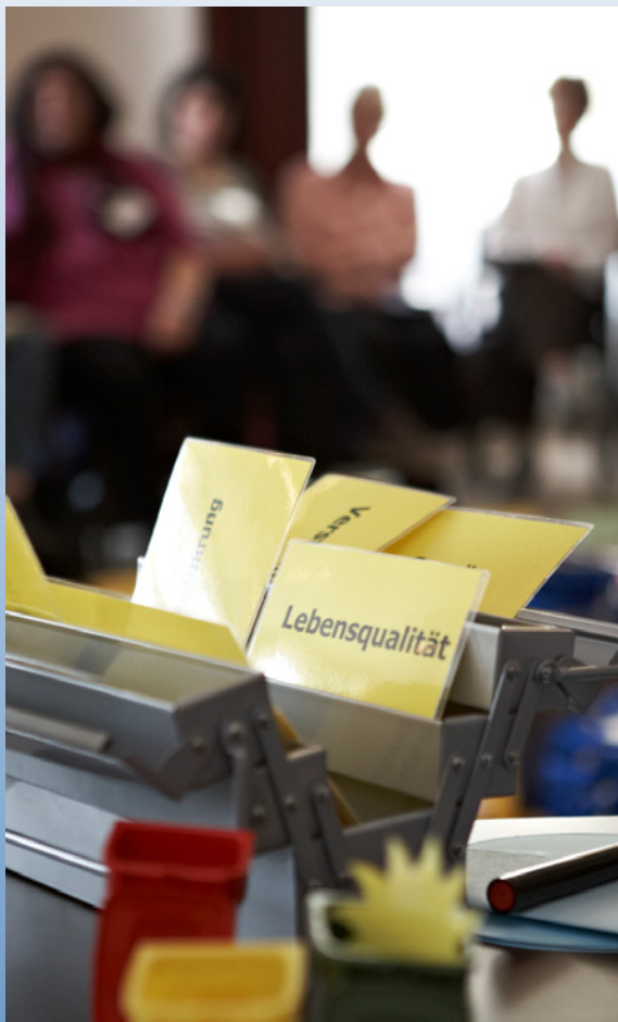
Fort- und Weiterbildungen zu unterschiedlichen Themen

Die Akademie Kinder-Hospiz Sternenbrücke wendet sich seit Januar 2011 mit einem umfangreich ausgerichteten Fort- und Weiterbildungsprogramm an Ärzt*innen, Gesundheits- und (Kinder-) Krankenpflegekräfte und Mitarbeiter*innen aus dem psychosozialen Bereich. Auch die Schulung von ehrenamtlichen Mitarbeiter*innen im Kinderhospizbereich, die Zusammenarbeit mit Krankenpflegesschulen sowie Seminarangebote für betroffene Eltern und Angehörige sind in die Akademie integriert.